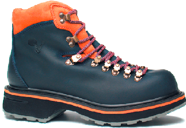
Suela HYBRID Gris