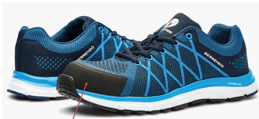
APLICACION EN TPU PARA MAYOR DURABILIDAD