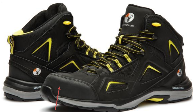
APLICACIONES EN TPU PARA MAYOR DURABILIDAD